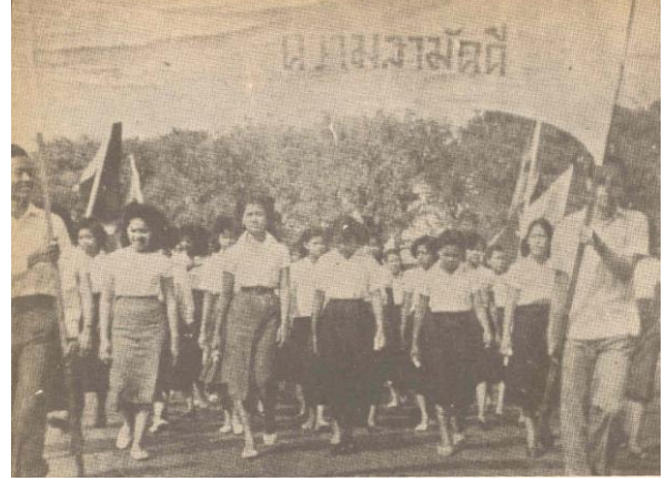
กรรมกรหญิงของกรรมกร ๑๖ หน่วย