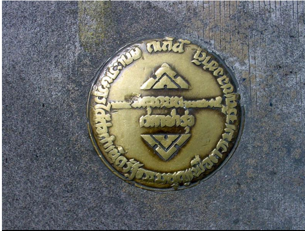
หมุดอภิวัฒน์ ๒๔๗๕