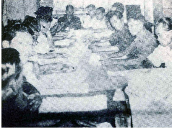
การประชุมกรรมกร ๑๖ หน่วย

ในช่วงปี พ.ศ. ๒๔๙๑ จอมพล ป.พิบูลสงคราม กลับมาครองอำนาจเป็น นายกรัฐมนตรี สมัยที่ ๓ อีกครั้ง แต่ครั้งนี้สัญญาว่าจะปกครองด้วยความเป็นประชาธิปไตย อย่างไรก็ตามในยุคนี้ รัฐบาลมีการแทรกแซงการรวมตัวของ กรรมกร ดย รัฐบาลได้จัด ตั้ง “สหบาลกรรมกรแห่งประเทศไทย ” ต่อมาเปลี่ยนชื่อเป็น “ สมาคมกรรมกรไทย ” และ “ สมาคมแรงงานเสรีแห่งประเทศไทย ” โดยให้เงินสนับสนุน และหาสำนักงานให้เพื่อหวังผลทางการเมือง ทำให้กรรมกรเกิดความแตกแยก สมาคม สหอาชีพะกรรมกรแห่งประเทศไทยเป็นเป้าหมายของการทำลายและล้มสลายลงในที่สุด แต่มีผู้นำ กรรมกรหัวก้าวหน้าจำนวนหนึ่ง แยกออกมาเคลื่อนไหวเพื่อเรียกร้องให้รัฐบาลออกกฎหมายแรงงาน เพื่อคุ้มครองคนงานกลุ่มนี้เรียกตัวเองว่ากลุ่ม “กรรมกร ๑๖ หน่วย” ต่อสู้เพื่อให้รัฐบาลออกกฎหมายเพื่อให้กรรมกรตั้งสหภาพแรงงานได้